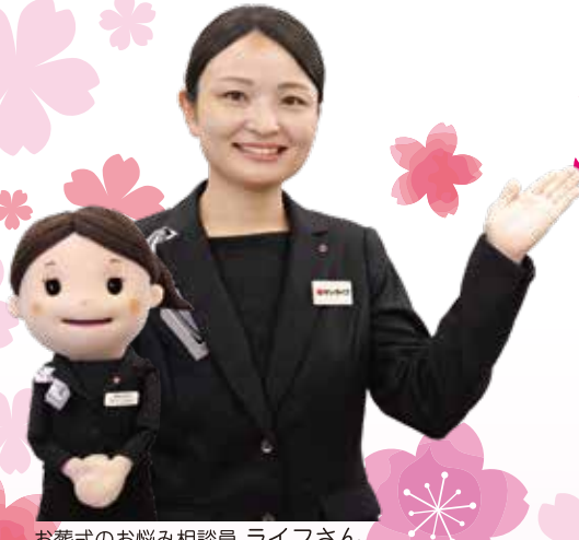
お葬式のお悩み相談員 ライフさん